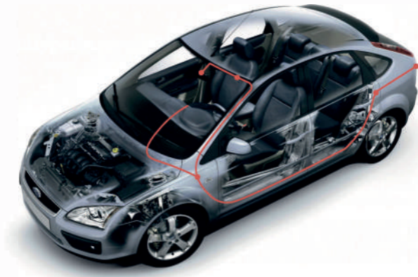
Рисунок ниже показывает пример подключения выносной камеры. Установите камеру в задней части салона автомобиля так, чтобы она не мешала Вам, и при этом был достаточный обзор для съёмки. Подключите камеру к разъёму на корпусе TrendVision DriveCam Real 4K Signature LNA.