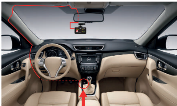
Автомобильная розетка (прикуриватель)

Пример установки кабеля питания, изображенный на картинке, рекомендован как наиболее безопасный, так как кабель не будет закрывать поле зрения водителя и отвлекать его от вождения.